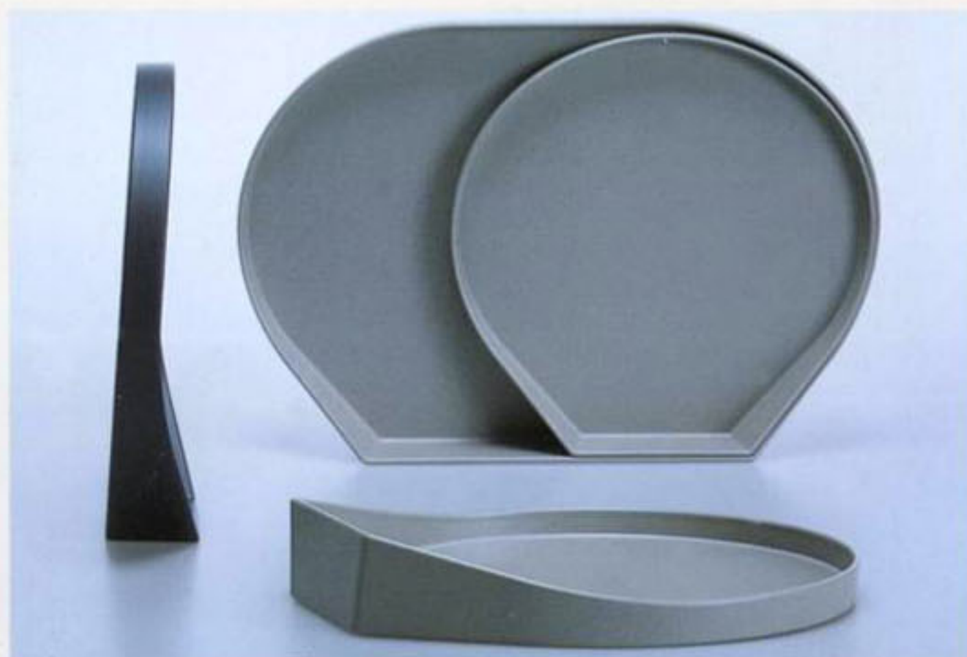
Design Giovanni Levanti