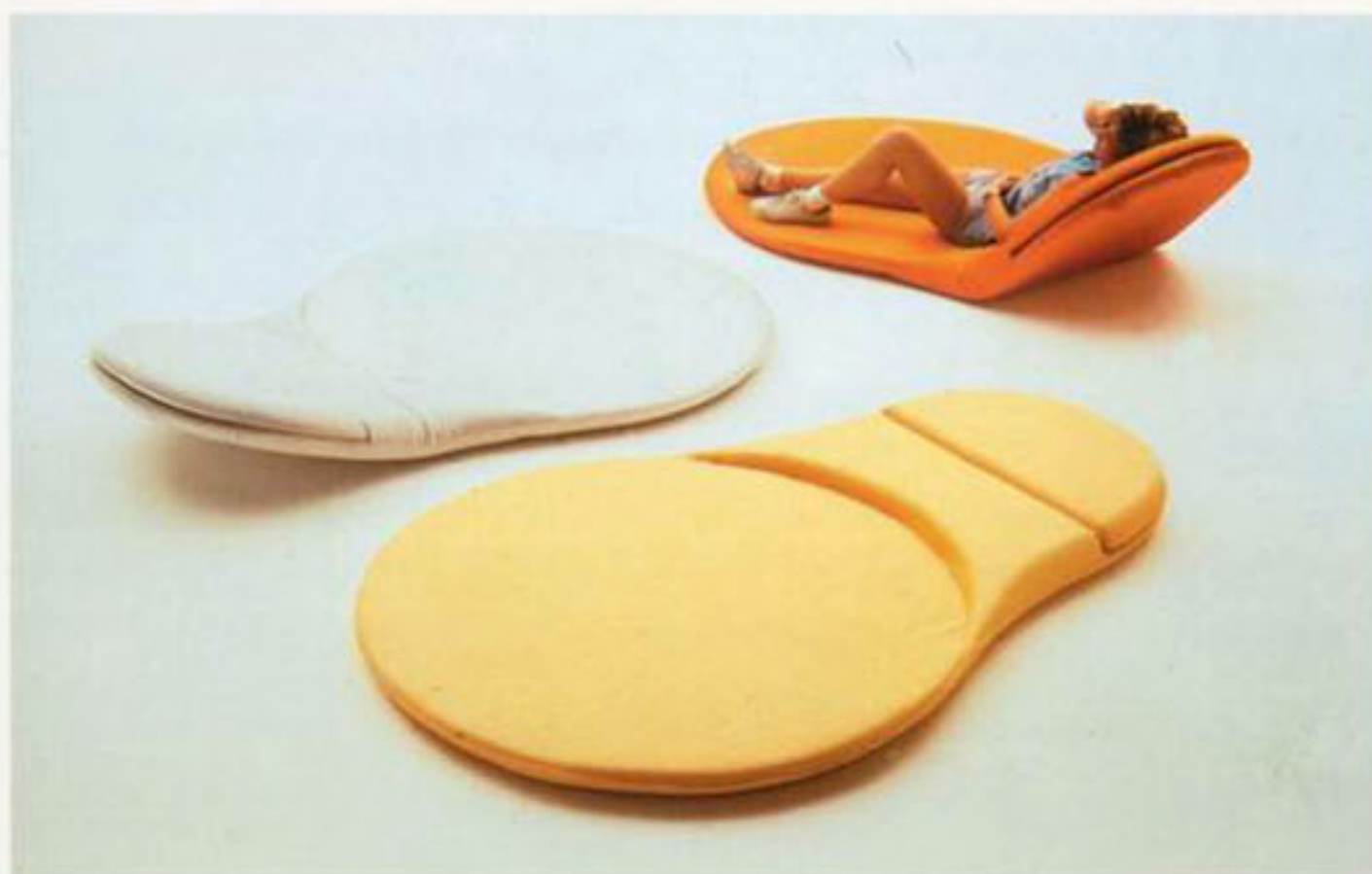
'Xito' Design Giovanni Levanti