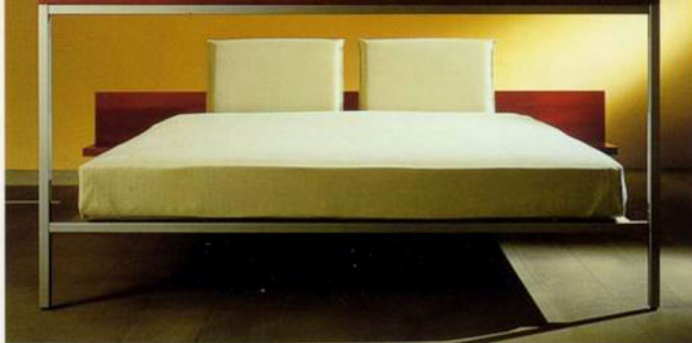
Design Giovanni Levanti

– Italiensk design har i 90'erne været temmelig blokeret, dels fordi der har været økonomisk krise, dels fordi det er svært for den unge generation at slå sig igennem. Mange af den ældre